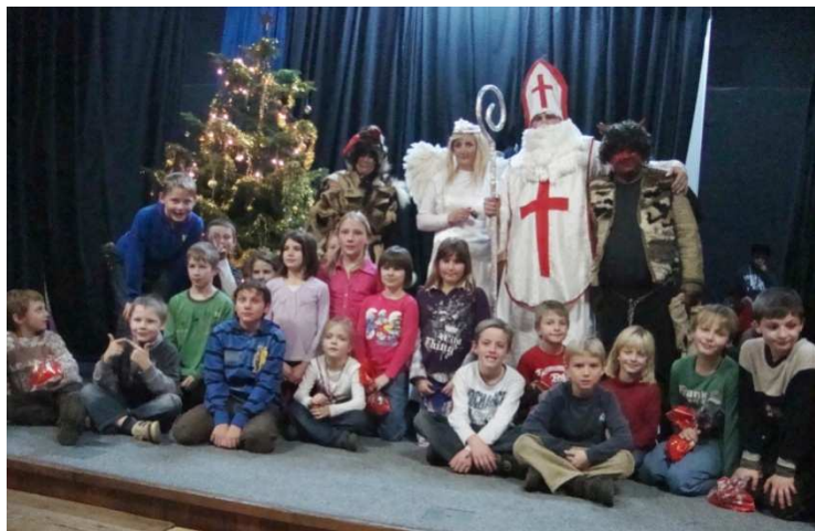
Mikulášská nadílka 30. listopadu 2012 v sokolovně.