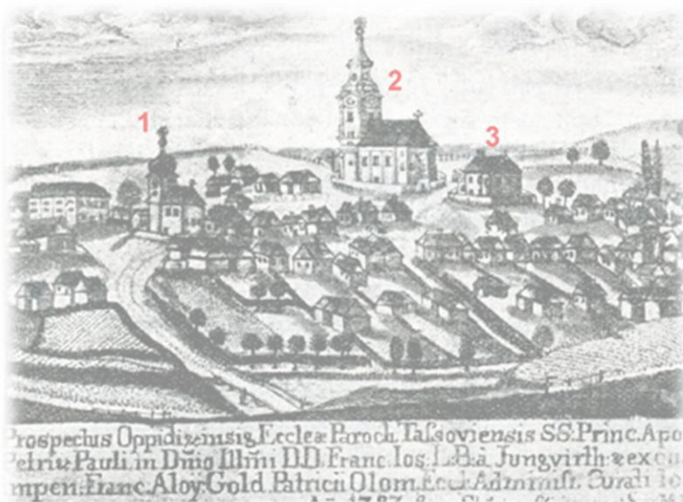
Výřez z prospektu Tasova z roku 1783. 1. kostel sv. Václava, 2. kostel sv. Petra a Pavla, 3. fara – bývalý kostel sv. Jiří (Kratochvíl 1907, 418).