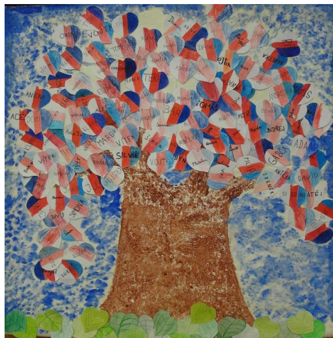
Školní akademie 2018