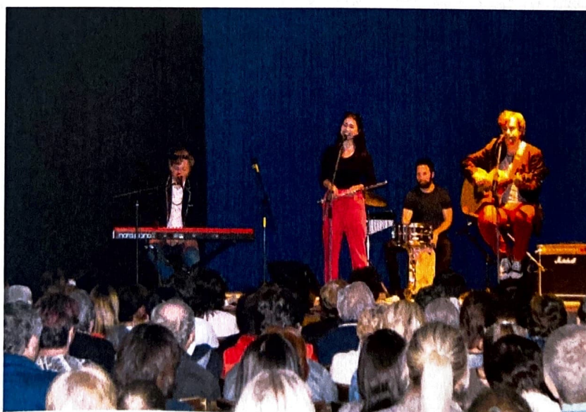
INSPEKTOR KLUZO v naplněné tasovské sokolovně