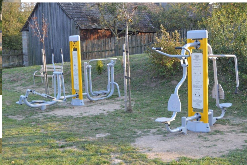
Posilovací stroje na dětském hřišti