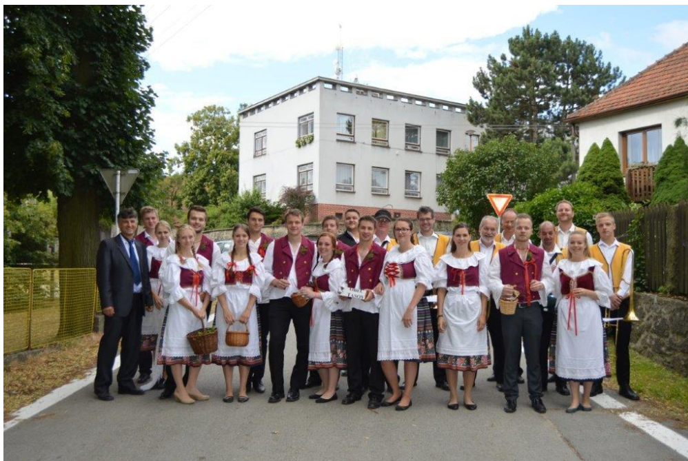
Tasovská pouť 2018

Zpravodaj obce Tasov. č. 35 (září 2018) vychází 4x ročně. Vydal: Obecní úřad Tasov, Tasov 240, 675 79, Tel: 566 547 159 email: zpravodaj@tasov-tr.cz, rádi uvítáme veškeré příspěvky, návrhy, nápady a připomínky.