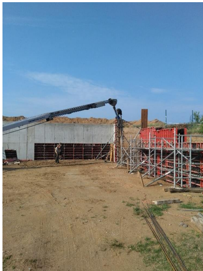
Výstavba univerzálního hřiště