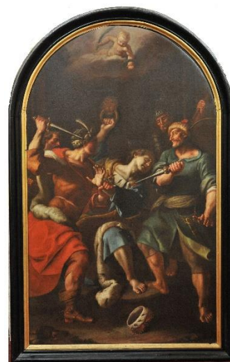
Oltářní obraz z kostela sv. Václava