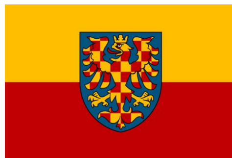
Současná podoba moravské vlajky

Nový impuls k rozšíření přišel po uvolnění poměrů po roce 1989. Tradiční žlutočervené moravské vlajky začaly být opatřovány zemským znakem – šachovanou orlicí v modrém poli, a to z důvodu odlišení od jiných podobných vlajek. Tato varianta si pro svoji srozumitelnost i estetickou úroveň získala velmi rychle oblibu po celé Moravě a stala se základní a všeobecně uznávanou podobou moravské vlajky současnosti.