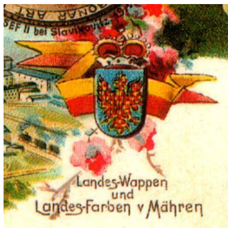
Zemské barvy a znak Moravy, 1900

Dnešní hojně rozšířená podoba moravské vlajky vychází ze zemských barev, zlaté a červené, kterých se od počátku 19. století používalo k výzdobě, později začaly být vyvěšovány i jako prapory. Oficiálního stvrzení se dočkaly v roce 1848, kdy poslanci Moravského zemského sněmu schválili 5. článek nové moravské ústavy, ve kterém se definuje zemský znak a zemské barvy: „Země moravská podrží dosavadní svůj erb zemský, totiž orlici vpravo hledící, v poli modrém a červenožlutě kostkovanou. Zemské barvy jsou zlatá a červená.“ Od stanovených zemských barev byla následně odvozena moravská vlajka, kterou tvoří dva vodorovné pruhy. Horní pruh je žlutý, spodní je červený. V druhé