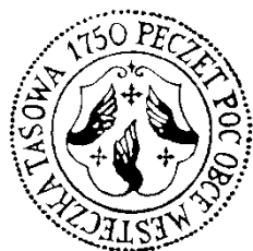
Pečeť městečka Tasova