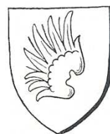
Erb pánů z Budišova