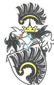
Erb pánů z Lomnice