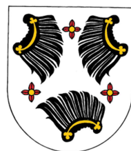
Znak obce Tasov