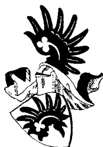
Erb Pánů z Tasova Jeho jiné vyobrazení